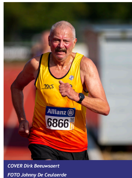
COVER Dirk Beeuwaert

Atletiek Vlaanderen vzw - @letiekleven 42 - Woensdag 11 september 2024