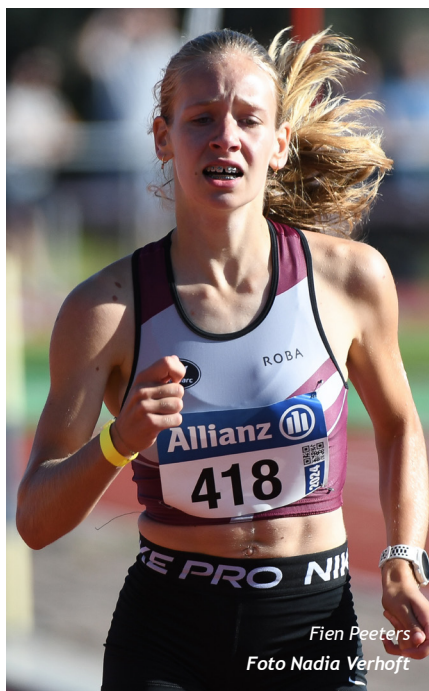
Fien Peeters

In de middellange afstandsnummers kenden de uiteindelijke winnaressen bij de cadetten weinig moeite om het goud in de wacht te slepen. Zo finishten de nieuwe Vlaamse kampioenen in de 800m en de 1500m met een bonus van zo'n 5 seconden op hun dichtste belagers. Fran Van Hollebeke/FLAC , eerder dit seizoen al goed voor 2'09"64, klokte een winnende 2'14"26 in de