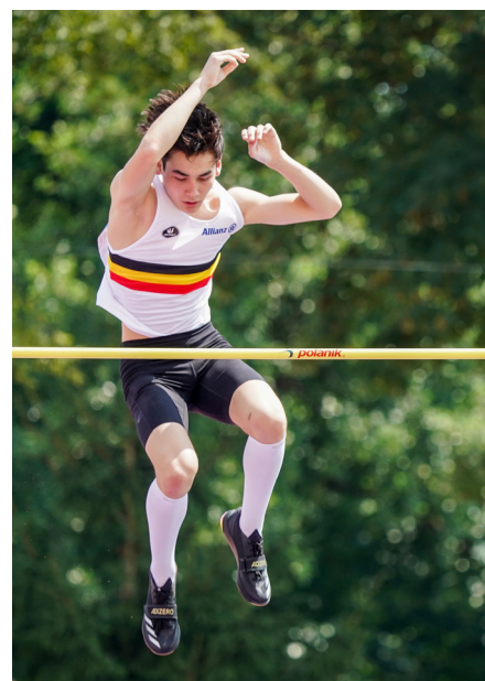
COVER Mathias Urbanczyk