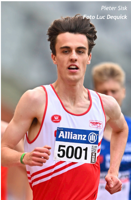
Pieter Sisk

Delphine Nkansa/RESC (goud 100m met 11"20): "Een weekje uitrusten heeft mij goed gedaan, want vorige week was ik nog doodop na een zware examenreeks."