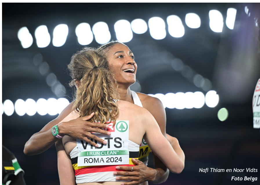
Nafi Thiam en Noor Vidts

Op dag twee waren alle ogen gericht op het meerkampduo Nafi Thiam en Noor Vidts. Beide gingen na een sterke eerste dag door op hun elan. Nafi kwam in het verspringen tot 6m59 en in het speerwerpen,