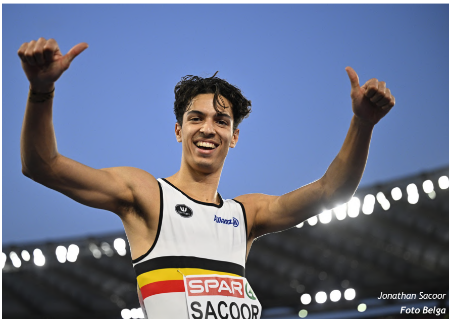
Jonathan Sacoor

Dag vier was er eentje voor de geschiedenisboeken. We waren getuige van een absolute topprestatie van Alexander Doom . Dat hij in vorm was, wisten we al. Dat hij