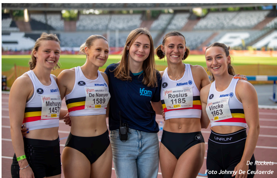
De Rockets