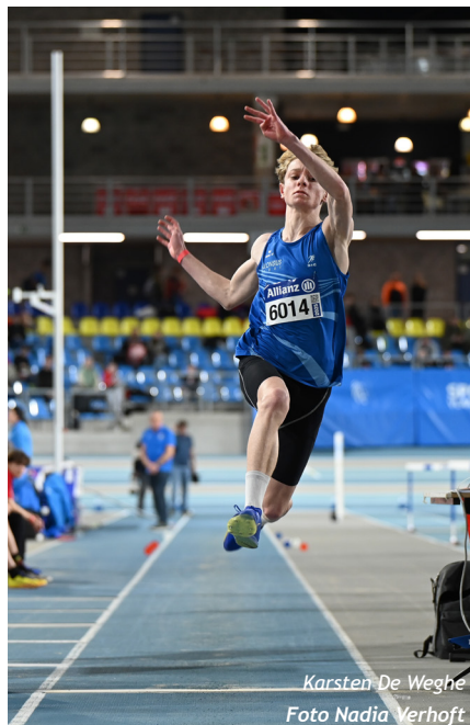
Karsten De Weghe

Joke Tytgat/ROBA (cadette, goud 800m in 2'20"25): "Ik wou nog eens een goede chrono neerzetten en besloot dus snel