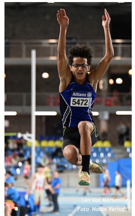
Len Van Marsenille