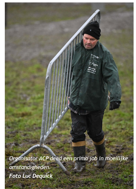
Organisator ACP deed een prima job in moeilijke omstandigheden.