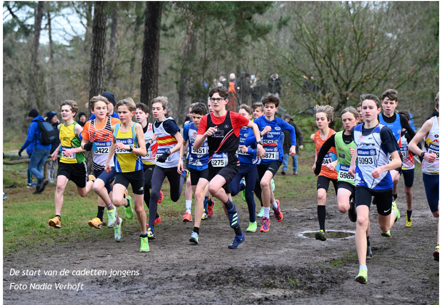
De start van de cadetten jongens

de leiding vast te houden. Volgend week-end loop ik de 800m op het PK indoor. Volgende maand neem ik nog deel aan het KVV veldlopen."