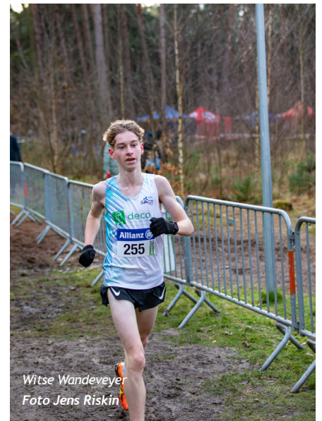
Witse Wandeveyer

Hoofdrolspeelsters bij de cadettes waren tweedejaars Fie Praet/MACD , Stien Roebben/ADD en Elle Arnauts/TACT