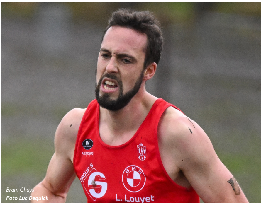
Bram Ghuys