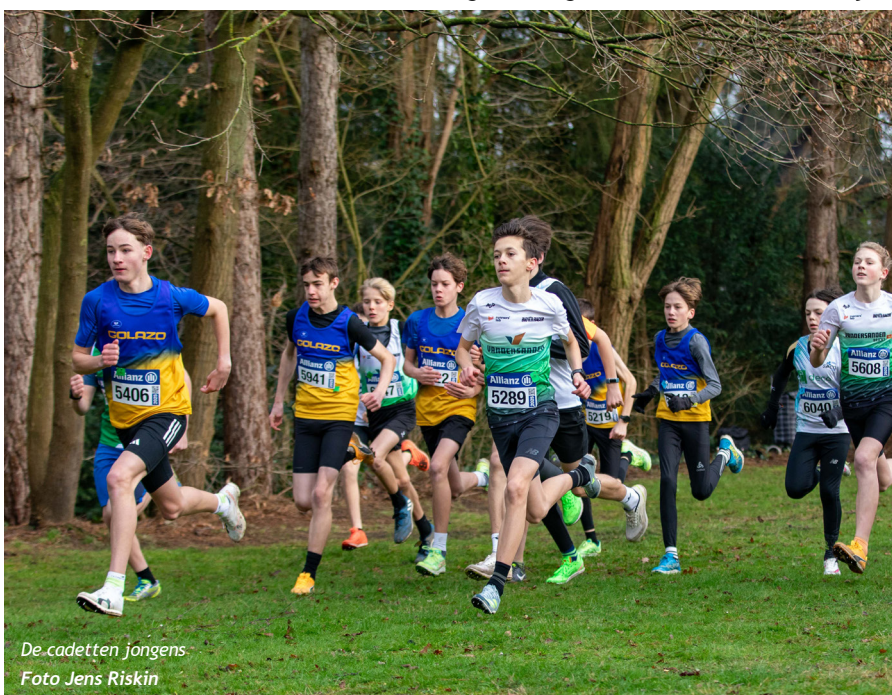
De cadetten jongens