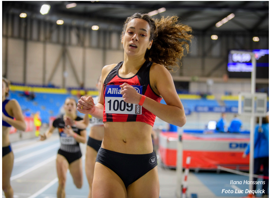
Ilana Hanssens

Kobe Vleminckx (AVLL - goud 60m in 6"72): "Ik ben eigenlijk niet echt tevreden over mijn prestaties vandaag. Ik be-